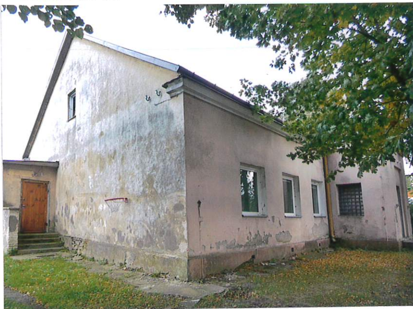
Fot. 1. Widok na północno-zachodni narożnik budynku (powyżej).